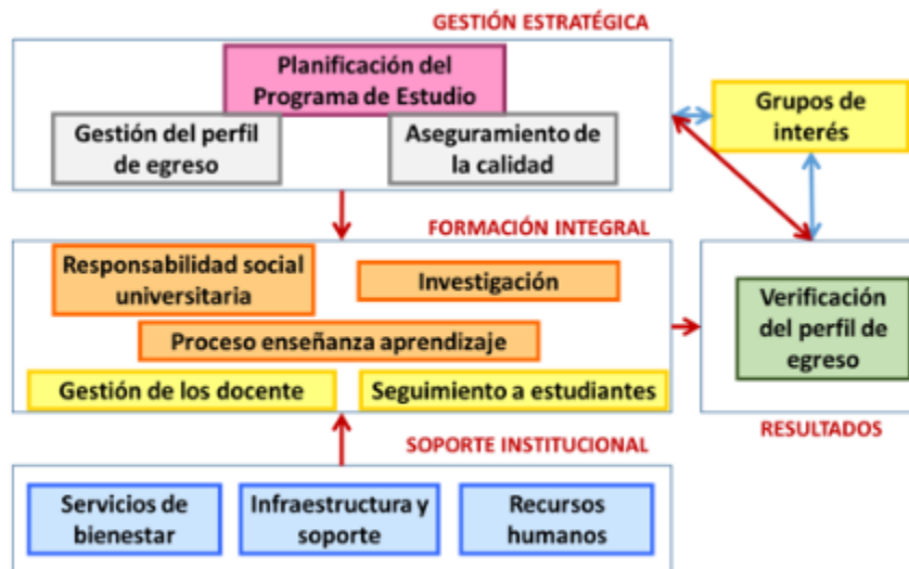
Relación de dimensiones y factores del modelo de acreditación de programas de estudios universitarios

El actual proceso de acreditación que lidera la SINEACE es el siguiente: